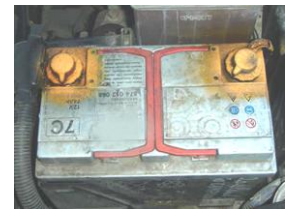
Batterie de véhicule léger