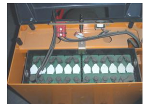
Accumulateurs de transpalette électrique